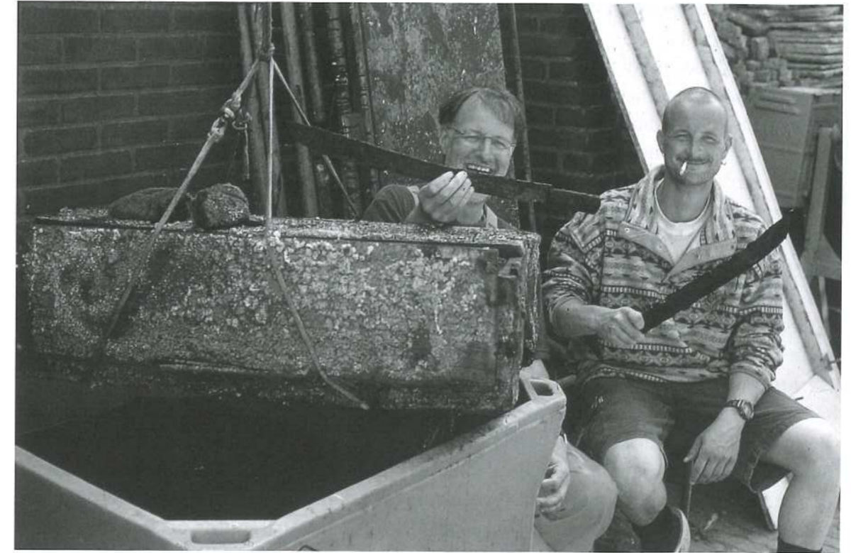
Afb. 42. Waddenzee * Bollen (maritieme archeologie). Vader en zoon Boom van garnalenkotter 'Emmie' tonen trots hun opgeviste vondst: een houten kist met een soort kapmessen.

Het wrak ligt tegen de Bollen, een ondiepte oost van Texel. In drie tijen is het schip geïnterpreteerd en ruwweg in kaart gebracht. Van de scheepsconstructie is alleen het vlak (scheepsbodem) te zien, van achterschip tot voorschip (noord-zuid), waarbij de stevens ontbreken. De achterstevens is overigens terug te vinden in de tuin van een particulier op Texel.