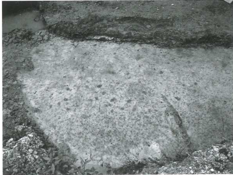
Afb. 41. Schagen * Regioplein. Paalgaatjes bij de aaneengekoekte aslaag aan de noordzijde van de sloot.

bijna ondoorbreekbare barrières aan de rand van de geul op. Temidden van de aspakketten lag een compleet runderskelet. Door wateroverlast geplaagd, werd besloten dit skelet voorlopig toe te dekken en in 2006 alsnog te bergen. De geul is in later tijd vol geraakt met klei, waarin zich aardewerk uit het eind van de 3de eeuw of later bevond, evenals enkele Romeinse importen. De vulling van de geul is dus in ieder geval ouder, waarschijnlijk daterend uit de 2de eeuw. Aan de noordzijde van de sloot werden vele tientallen stokindrukken gevonden van wat waarschijnlijk een afrastering is geweest (afb. 41). Tot nog toe zijn er geen voorwerpen gevonden die een duidelijke verklaring geven voor de aspakketten die zich tot ver in de omtrek uitstrekken. Evenmin zijn er veel aanwijzingen voor alledaagse bezigheden: een halve spintol temidden van tonnen as en scherven is niet veel. Door uitgestelde bouwactiviteiten zal er in de eerste helft van 2006 de mogelijkheid van verder onderzoek zijn.